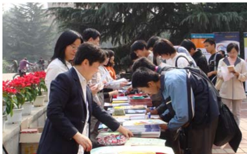
宣传月首日开放咨询活动现场

启动仪式举行的同时，图书馆门前喷泉广场有主题展览、现场咨询、资料派发、有奖调查等活动。图书馆首次将咨询台搬到了馆外，馆员使用无线网络，现场为读者解难答疑，回答读者在利用图书馆的过程中遇到的问题。活动吸引了众多读者的关注和热情参与，在 3 个半小时的现场咨询活动中，共派发宣传资料 1200 余份，发放并回收读者调查 690 份，解答各种读者咨询近百个。