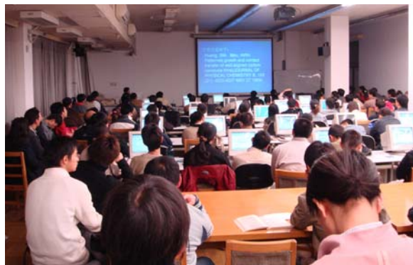
宣传月期间系列培训讲座现场

图书馆一向将读者需求作为改进工作的驱动力。因此宣传推展月期间图书馆从多个渠道加强与读者沟通，除了现场咨询活动中向读者发放问卷之外，还在网上进行读者调查。此次调查活动得到了读者的大力支持和积极参与，在推展月期间共有 11496 人次参加了网络投票。调查结束后图书馆根据调查结果研究相应措施，开通了“借阅历史查询”服务，并正筹备在紫荆公寓区建立新的还书点（试运行）等。此外，图书馆学生顾问、航空四班素质拓展计划、一些学生志愿者都对此次图书馆宣传月活动给予了高度关注，或积极献言献策、或主动为图书馆提供宣传和协助。读者在系列讲座后留言：“举办宣传月非常好！清华的学习资源很丰厚，如若学生不会利用，不会操作的话等于是望“金山”而兴叹！”