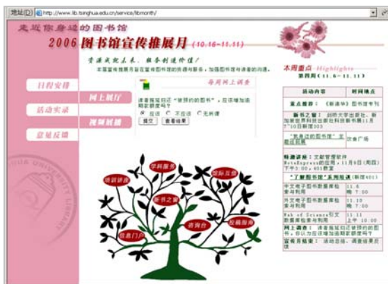
宣传月专属网站首页

为读者作了精彩报告。宣传推展月专属网站上及时发布宣传月的相关日程安排以及活动实录、并集中对图书馆各项新服务进行推介，截至宣传推展月闭幕之际，访问量达 143 387。